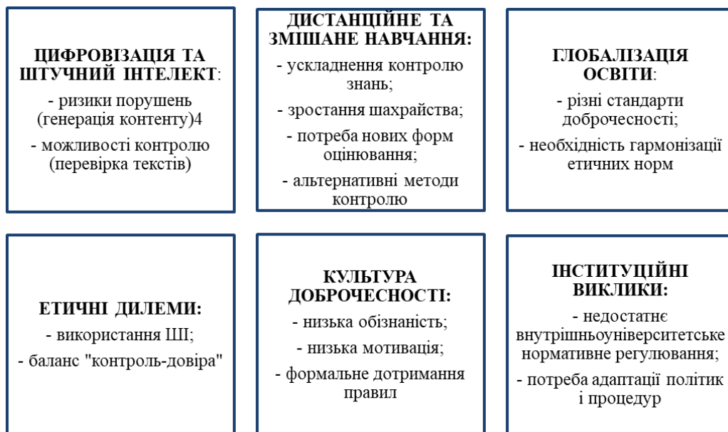
Рис. 3. Сучасні виклики академічної доброчесності*

використовувати цифрові інструменти моніторингу.