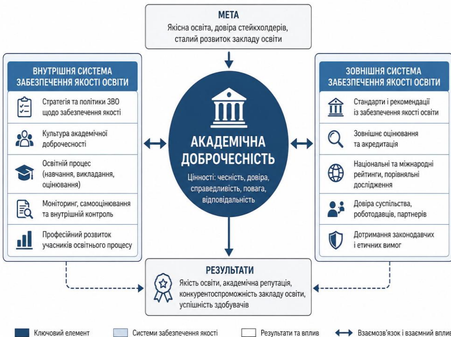
Рис. 1. Академічна доброчесність як ключовий елемент внутрішньої та зовнішньої системи забезпечення якості освіти*