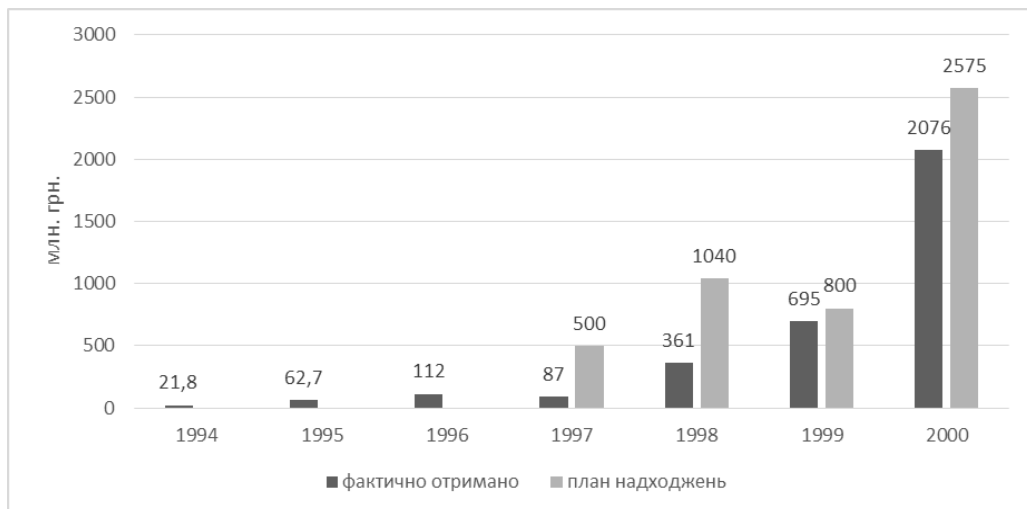
Рис. 1. Планові та фактичні обсяги надходження коштів від приватизації державного майна до бюджету України за 1994 – 2000 рр.

січні 1995 р. Закон України «Про оподаткування прибутку підприємств» скасував усі пільги для СП і ті, що зареєструвалися після 01.01.1995 р. оподатковувалися за загальною схемою. Приватизація, яка після мораторію з липня 1994 р. була відновлена в 1995 р. не стала каталізатором для залучення іноземних інвестицій. У своєму дослідженні Т. Кізіма (1997) наводить такі дані: «у 1995 році за участю іноземних інвесторів приватизовано тільки 5 підприємств із 104, які були затверджені урядом для приватизації із залученням іноземних інвестицій. В результаті міжнародних тендерів приватизовані Тростянецька кондитерська фабрика «Україна» (Сумська обл.), в/о «Азот» (м. Черкаси), завод «Дніпропобутхім» (м. Дніпропетровськ), Трипільський біохімічний завод (Київська обл.) на загальну суму 107 млн.дол. (з них 12,5 млн.дол. направлено в держбюджет у вигляді податків)» [22, с.35]. В березні 1996 р. був прийнятий Закон України «Про режим іноземного інвестування», який визначав основні параметри правового поля стосовно іноземних інвестицій [23]. Проте приватизація виявилася неефективною (рис. 1) через [23]: неефективність державної регуляторної політики, наявність в Україні неформальної системи регулювання допуску іноземних інвесторів в економіку.