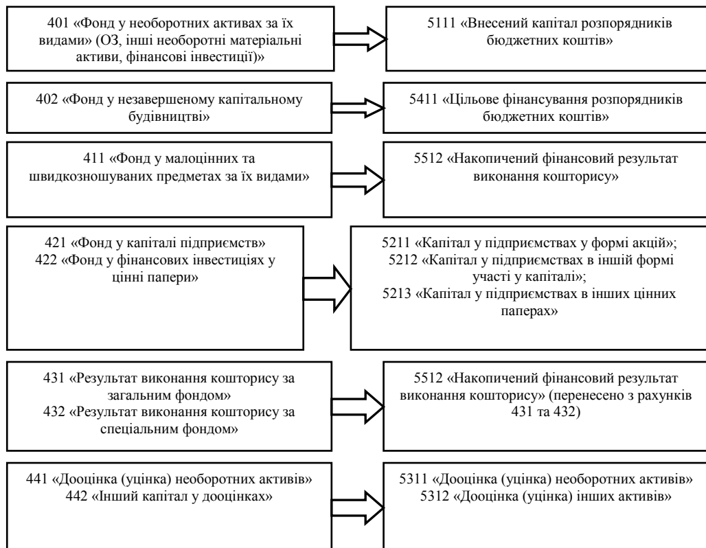
Рис. 2. Порівняльні показники в розрізі субрахунків власного капіталу

Як видно, для обліку власного капіталу призначено пасивні субрахунки класу 5 «Капітал та фінансовий результат» згідно Плану рахунків бухгалтерського обліку в державному секторі від 31.12.2013 № 1203 [8]. Субрахунки для обліку власного капіталу розпорядниками бюджетних коштів наведено на рис. 3.